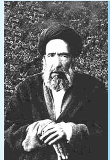
↑ شهید آیت‌الله مدرس

۶. استفاده از برخی واژه‌ها و عبارات که درک آن‌ها برای دانش‌آموزان سخت است؛ مثل عبارت‌های: «عقاب ذکور» (ص ۸۵) و «خلع ید شرکت نفت» (ص ۱۱۵). در صفحه ۱۱۴ بند دوم سطر دوم جمله‌ای به این ترتیب آمده: «این طرح در مجلس طرح نشد»، که بهتر است به جای کلمه «طرح» دوم کلمه «مطرح» استفاده شود.