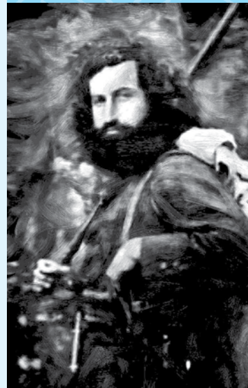
↑ میرزا کوچک خان

قسمت‌های «بیشتر بدانید» و «برگی از تاریخ»، انگیزه مطالعه را در دانش‌آموز افزایش می‌دهد.